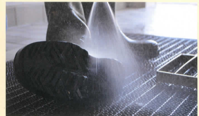
Reinigung und Desinfektion der Stiefel vor und nach dem Betreten des Stalls