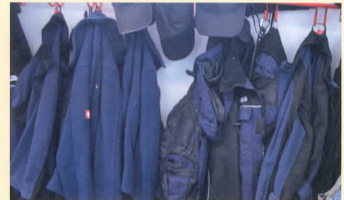
Betreten der Ställe ausschließlich in Stallbekleidung